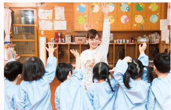
通过实习来培养学生的专业能力