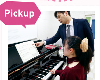
会为不擅长钢琴的学生提供1对1的个别授课(拥有30间钢琴练习室)