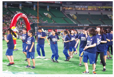
每年都会以志愿者的身份去参加各种活动 (在参加优衣库举办的青少年足球活动时的照片)