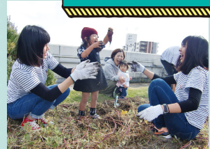
综合短期大学独有的“保育园艺课” (在屋顶花园体验挖白薯时的照片)