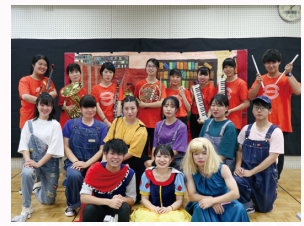
深受参观者的好评! 保育专业生表演的音乐剧