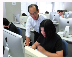
学习在工作上需要的电脑技术的“计算机信息课”