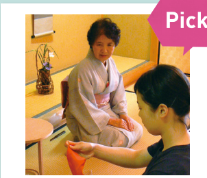
通过了解日本文化的茶道来学习礼法的“茶道文化课”