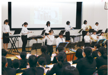
发表在研究室上的研究成果和活动成果