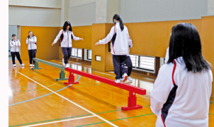
提升幼儿的平衡能力和节奏感的“肢体活动课”