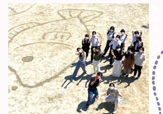
提升幼儿表现力方式的课程“保育内容的认识和保育的方法(感官游戏)”