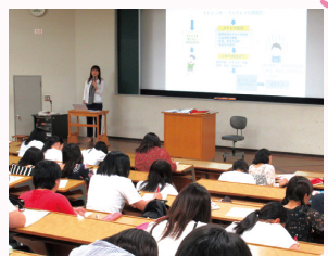
学习成为保育工作者所需要的专业知识